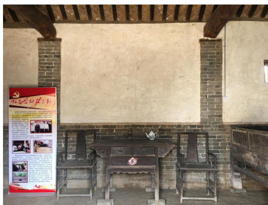
曹县鲁西银行印刷所旧址-红色金融展