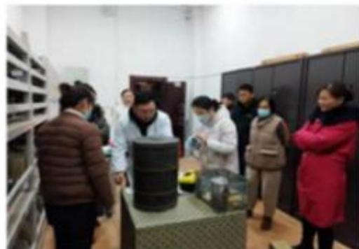
革命文物保护修复

一、文物保护工作。2022 年 8 月我馆委托资质单位编制了《曹县博物馆可移动文物预防性保护方案》《曹县博物馆馆藏革命文物保护修复方案》，并通过省文旅厅审批，2023 年 4 月我馆正式启动了馆藏革命文物保护修复工作和可移动文物预防性保护实施工作，目前两个项目已基本完工，计划于 2023 年底前完成项目结项验收工作。为积极推进我馆的馆藏文物数字化保护利用项目，在前期邀请资质单位编制完成《曹县博物馆馆藏珍贵文物数字化保护方案》并获得了省文旅厅批复的基础上，于 2023 年 8 月申请了 2024 年度国家文物保护专项资金。下一步待资金拨付到位后尽快履行招投标程序，完成项目实施，进一步提升馆藏珍贵文物数字化保护水平。